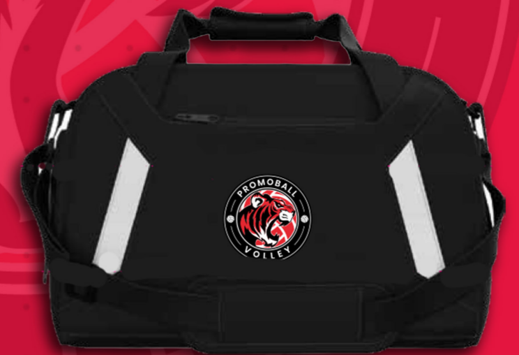
Borsone Promoball B